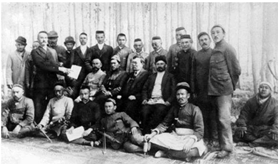
Делегация Национального совета Алаш-Орда во главе с Ахметом Байтурсулы в Чугучаке (Китай). 1918 год.