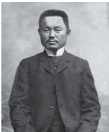
Мухаметжан Тынышбайулы (1879-1937) – заместитель премьер-министра Автономии Алаш.