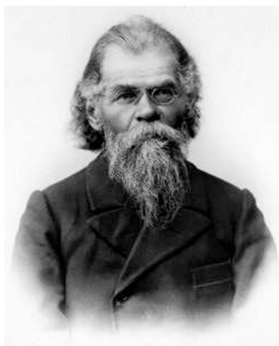
Григорий Потанин (1835-1920) – член Национального совета Алаш-Орда.