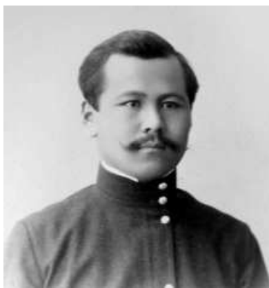
Мустафа Шокай – юрист, бывший глава Туркестанского мухтариата (Кокандской автономии), член Национального совета Алаш-Орда.