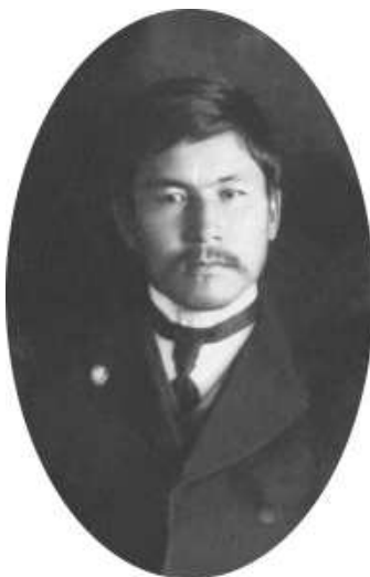
Алихан Букейхан (1866-1937) – основатель, глава и премьер-министр Автономии Алаш.

Все 15 членов Национального совета Алаш-Орда – в ноябре 1917 года были избраны в депутаты Всероссийского Учредительного собрания.