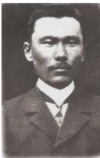
Омар Алмасулы – кандидат в члены (комиссара) Национального совета Алаш-Орда.