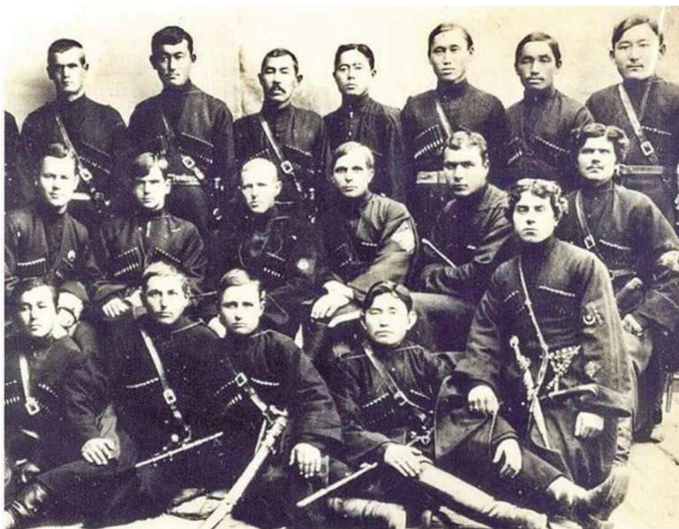
3-й кавалерийский полк армии Автономии Алаш, воевавшей против Советской власти на Семиреченском фронте в составе дивизии казачьего атамана Анненкова.