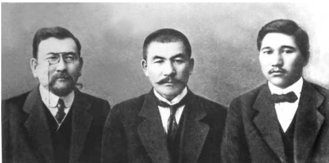
Лидер казахского национально-освободительного движения Алаш начала XX века, основатель, глава и премьер-министр Автономии Алаш Алихан Букейхан со своими верными соратниками Ахметом Байтурсынулы и Миржакыпом Дулатом. Оренбург, 1913 г.