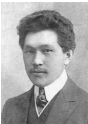
Уалитхан Танашулы (1887-1938) – комиссар правительства Алаш-Орда.