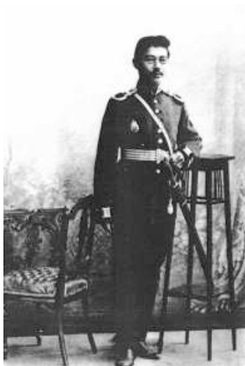
Халел Досмухамедулы – военный врач, член Национального совета Алаш-Орда.